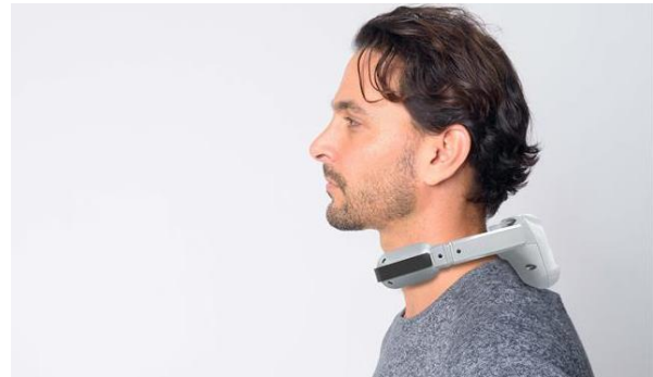
一体型のコンパクトモデル

当社のウェアラブルエアコンは、ペルチェ素子を利用したネッククーラーで、外部温度に対して最大-20°Cの冷却能力を発揮し、首に装着することで頸部を冷やします。当社の強みである空調技術やノウハウを応用して、内蔵する熱交換部でペルチェ素子から発生する熱を水に放熱し、40°Cを超える過酷な環境でも一貫して優れた冷却性能を発揮するプロ仕様です。2021 年の発売以来、鉄鋼業やプラント業など、過酷な猛暑下で働く職場を有する 500 社以上の国内企業で採用され、数々の猛暑現場で活躍しています ※1 。