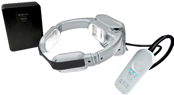
ウェアラブルエアコン