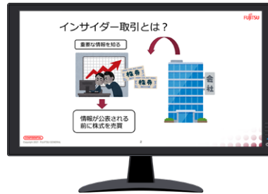
インサイダー取引に関する社内教育のイメージ

FUJITSU GENERAL Way の行動規範「法令を遵守します」および「機密を保持します」に基づき、インサイダー取引を未然に防止し、企業としての社会的責任を果たすために、「インサイダー取引防止規程」を制定しています。一例として、社員が当社の特定有価証券等の売買その他の取引をするときは、事前の届け出を義務付けています。また、社員に対しインサイダー取引に関する社内教育を行い、インサイダー情報および機密情報の取り扱い等に関する法令および社内規程の遵守を徹底しています。