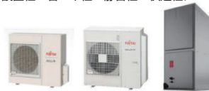
北米向け共同開発エアコン

■ 米国 Rheem 社との共同開発第一弾となるエアコンを発売 北米市場での更なる販売拡大に向け、米国 Rheem 社との共同開発により、設置性・省エネ性・静音性・快適性に優れたマルチボジションタイプの全館空調方式エアコンを発売。