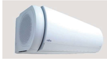
「ノクリア」Xシリーズ

■ 新型「ノクリア」Xシリーズ発売 使う人の生活リズムをAIが学習し、業界で初めて不在時に自動で「熱交換器加熱除菌」を行う新型「ノクリア」Xシリーズを発売。