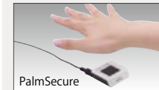
手のひら静脈認証装置

不正対策のため、手のひら静脈認証装置、自動釣銭釣札機 (グローリー社製) と連携が可能です。