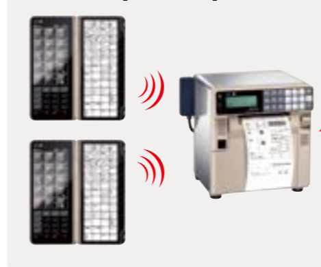
売上見込情報確認