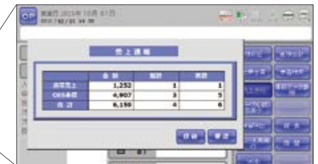
[売上見込情報画面]