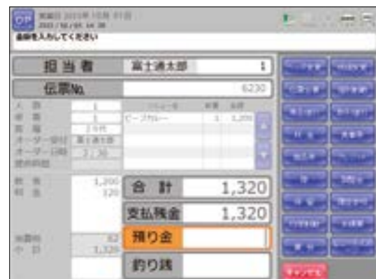
[テイクアウト業態画面]